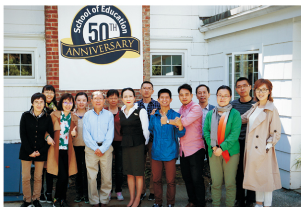
我校教师在“广东财经大学国际化师资海外研修基地·美国佩斯大学站”研修

(1) 与澳大利亚西澳大学、澳大利亚科廷大学、德国欧福大学、挪威商学院等国外名校的双硕士项目；(2) 与南非开普敦大学、澳大利亚科廷大学、英国东伦敦大学的博士生联合培养项目；(3) 在“广东财经大学海外实践教学平台”德国基地、新西兰基地、阿根廷基地和意大利基地开展的暑期创新创业教育或美育拓展活动；(4) 与 Each Future Cultural Network 等共同组织的赴美带薪实习项目。