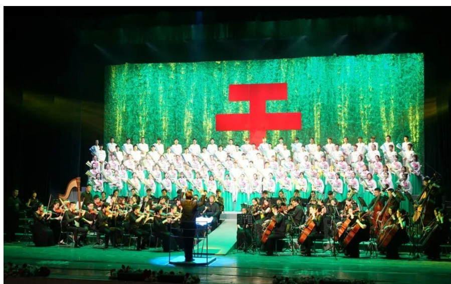
清唱剧《梨树花开》参加辽宁省第十届艺术节剧目展演