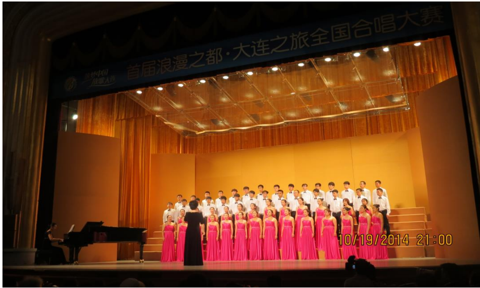
学院雷锋合唱团参加全国合唱大赛获“金牡丹奖”

学院自 2010 年起开展艺术惠民工程，先后与多家文化馆站、社区、中小学建立了实践教学平台，并常年开设艺术讲堂、惠民课堂，坚持惠民演出等，受众超百万人次。