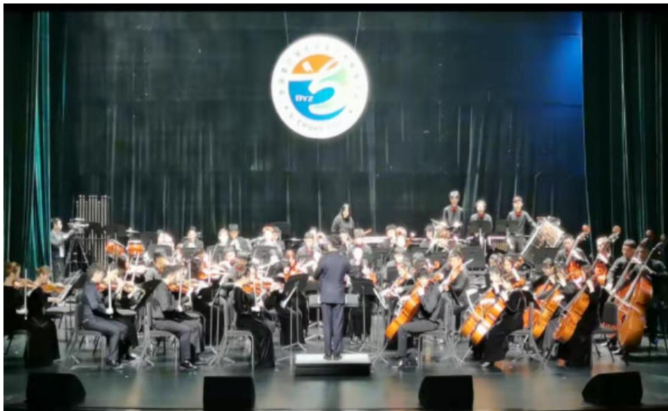
学院青年交响乐团 2021 年参加全国第六届大学生艺术展演并获一等奖

学院建有青年交响乐团、雷锋合唱团等多个艺术实践平台，自 2011 年起一直作为全国“高雅艺术进校园”活动承演单位，多次走进大中专院校进行专场演出。雷锋合唱团在首届全国合唱大赛中获得“一等奖”。青年交响乐团在全国第五届、第六届大学生艺术展演中连续获得一等奖，并在全国首届校际比赛中获得第一名。