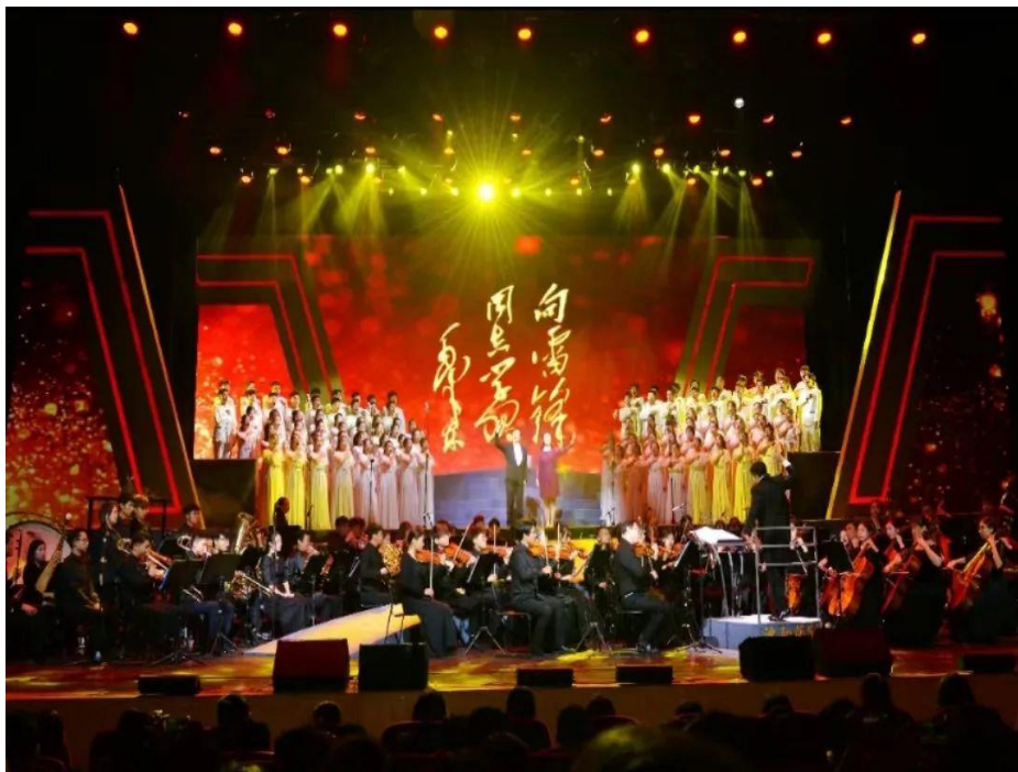
大型交响组歌《新时代的精神脊梁——辽宁英模颂》举行社会公演