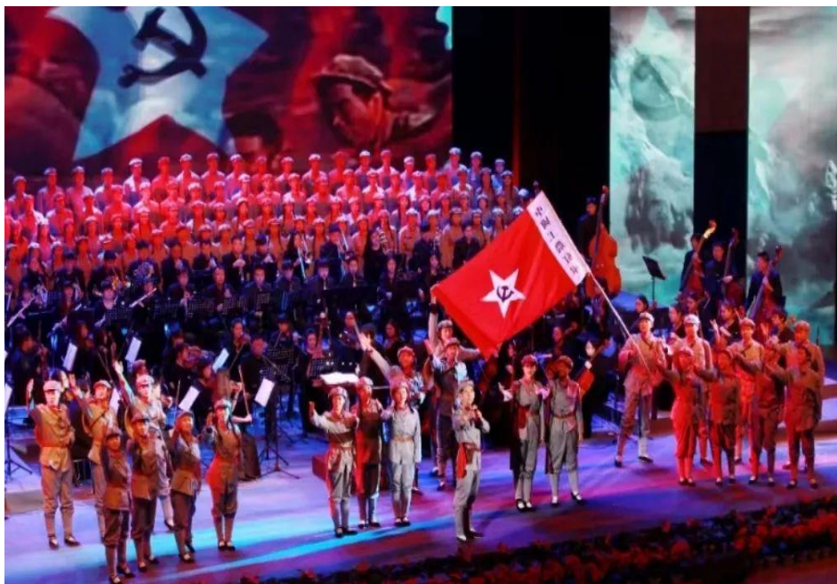
纪念红军长征胜利 80 周年视听交响音乐会

学院自 2010 年起开展艺术惠民工程，先后与多家文化馆站、社区、中小学建立了实践教学平台，并常年开设艺术讲堂、惠民课堂，坚持惠民演出等，受众超百万人次。