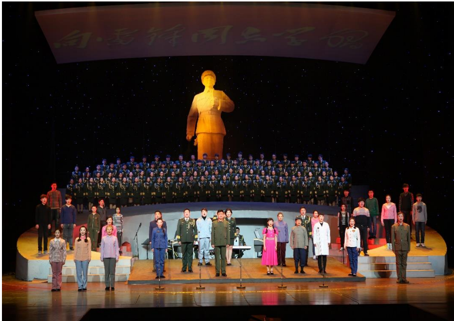
清唱剧《雷锋》举行社会公演